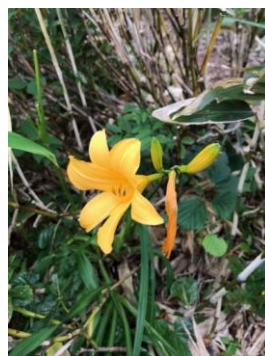
ニコウキスゲ