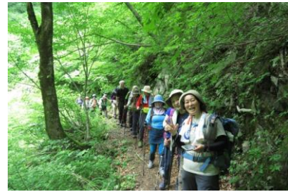
夜叉ヶ滝を向いに