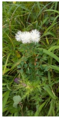
モミジカラマツ花